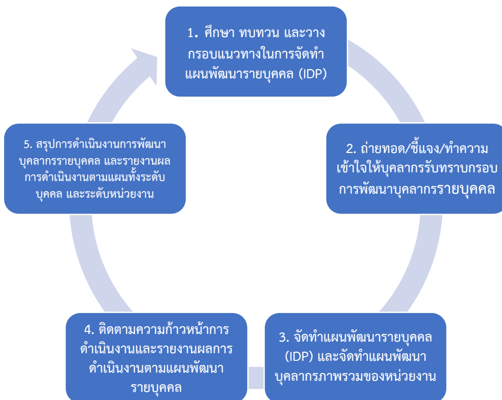
ภาพที่ 1 กระบวนการและลำดับขั้นตอนการจัดทำแผนพัฒนาบุคลากรรายบุคคล

การจัดทำแผนพัฒนาบุคลากรรายบุคคล คณะนิติศาสตร์ ประจำปีงบประมาณ พ.ศ. 2562 เป็นกระบวนการแปลงแผนยุทธศาสตร์การพัฒนาทรัพยากรบุคคล พ.ศ. 2560-2564 สู่การปฏิบัติ โดยสรุปกระบวนการ ดังต่อไปนี้